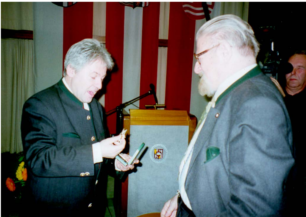
Verleihung des Ehrenzeichens des Landes Oberösterreich durch LH Dr. Josef Pühringer