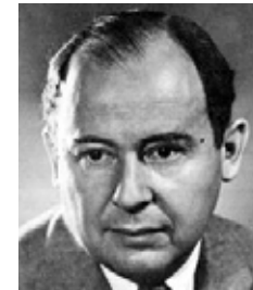
John v. Neumann